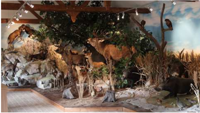
A Verga Zrt Hubertus Erdei iskolájának Fekete István diorámája

alakban, eredeti élőhelyük megjelenítésével. Az interaktív rész kettő, egymástól jól elkülöníthető szinten tartalmazza valamennyi faj hangját, szaporodásbiológiáját, táplálkozását, aktuális agancs-szarv fejlődését, trófeabírálatát. Az alapszint iskolásoknak készült, a bővített rész akár a vadászvizsgára készülőknek, szakmai érdeklődőknek nyújt információkat 2013. évi szakmai publikációkkal aktualizálva, külön irodalmi összefoglalóval. Az anyag olvasható magyar és angol, valamint rövidesen német nyelven is, Szerzői: Prof. Dr. Sugár László egyetemi tanár és Tóth Csaba Ph.D vadászati múzeumigazgató. A képeket Polster Gabriella természetfotós, a preparátumokat Magyarovics Károly preparátor, a háttérképeket és a rajzokat Boros Zoltán festőművész készítette.