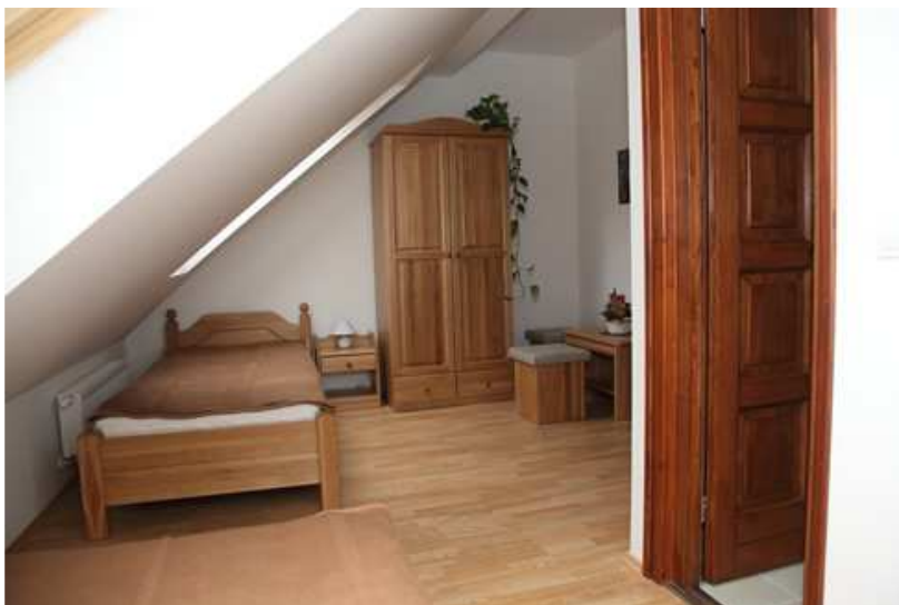
A Verga Zrt Hubertus Erdei Iskolája a Közjóléti fejlesztések keretében 12 új korszerű szálláshellyel bővült.

A dioráma névadója gazdász, író, a magyar vadász- és szépirodalom egyik legjelentősebb és legolvasottabb alkotója. Művei élményt, ismeretszerzést, tapasztalást, ugyanakkor egy letisztult világnézetet, érzelmi, erkölcsi iránymutatást adnak. Általa felfedezhetjük a természet szépségét, megcsodálhatjuk a magyar nyelv kifejezőerejét. Írásai példát adnak hitből, nemzeti elkötelezettségből. Regényeiben bemutatja az ember és a természet igazi viszonyát, a teremtett világ sokszínű, izgalmas és küzdelmes gyönyörűségét. Fialat házasként feleségével Ajkára költözött. Itt kapott állást vezető gazdatisztként egy holland származású földbirtokos birtokán. Új, minőségi szálláshelyekkel bővült a Hubertus Erdei Iskola. A 6 db átadott szoba gyönyörű erdei környezetben található. A szálláshely a természet nyugalmát és szépségét keresők rejtekhelye a Bakonyban, a természet üdítő erejével regenerálja, és új energiákkal tölti fel vendégeit, pontosan azt kínálja, ami hiányzik a hétköznapijainkból. Különleges, erdei környezet, amely a gyermekek számára izgalmas és felfedezéseket, a szülők számára nyugalmat és kikapcsolódást jelent. A VERGA Zrt. a kalandra vágyókat is várja, akik szívesen vágnak neki az erdőnek gyalog vagy kerékpárral.