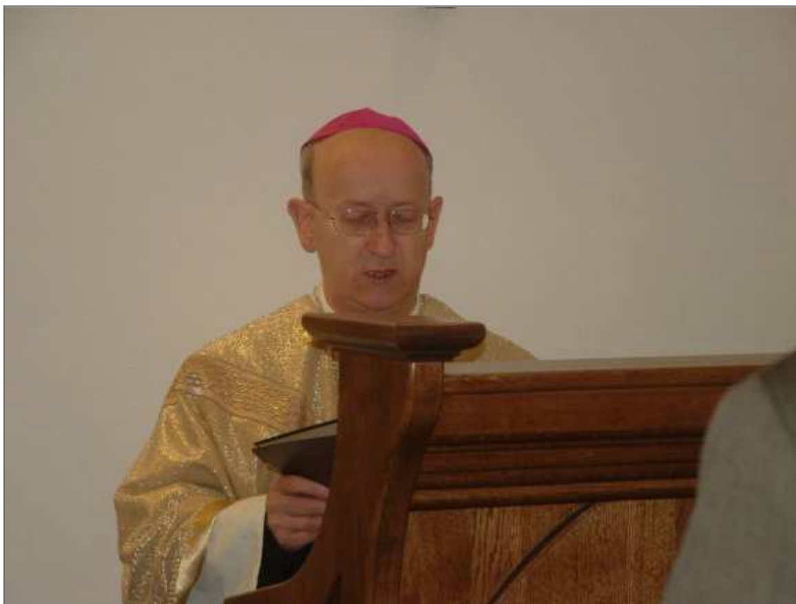
Márfi Gyula érsek

← Márfi Gyula érsek felszentelő áldásában az új helyükön, a természet közepén köszöntötte a madonna szobrokat. Kérte az Istent, hogy a szobor előtt imádkozókat hallgassa meg és teljesítse kéréseket, mert a „hit, az Istentől kapott áldás”. Az érsek megszentelte a két madonnát és a példa beszédében a Mária hit fontosságáról és egyetemességéről beszélt. →