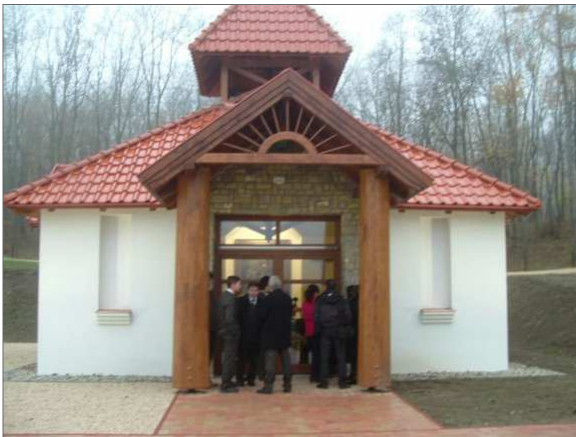
A Szent Imre kápolna

A vezérigazgató elmondta, hogy a gazdasági társulatuknak a Herendi Porcelánmanufaktúra Zrt -vel már hagyományosan jó együttműködésük van. A most átadásra került ajándék nem csak egy esztétikai szépség, hanem mind anyagiakban és mind lelkiekben is gazdagabbá tette a Szent Imre kápolnát, valamint azokat, akik betérnek imádkozni ide. Ezért nagyon köszönik ezt a nemes gesztust és azt ígérte, hogy a jövőben nagyon fognak vigyázni ezekre az értékes ereklyékre.