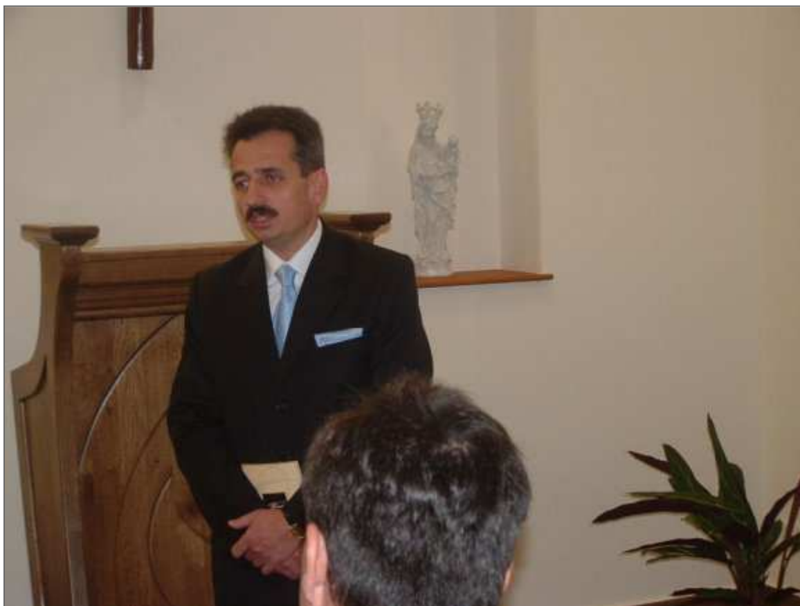
A madonna átadása

A vezérigazgató szerint a porcelángyártás alapanyaga a kaolin, a mai napig egy nagy titok. Az anyag végtermékét a legkorszerűbb eljárásokkal sem tudják ma még előre modellezni, csak a gondviselésen múlik az, hogy a végén milyen minőséget fognak kapni. Azt szeretnék elérni, hogy az utókornak minél többet átadjanak ezekből a titkokból, többet annál, mint amit a mostani szakemberek kaptak az elődeiktől.